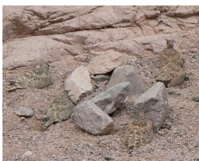
wie ziet de vogels