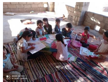
Les bij de juf thuis